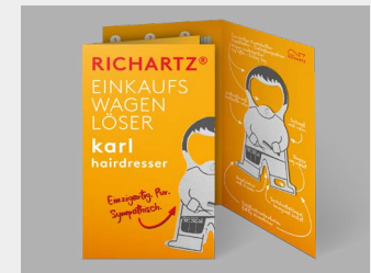
... mit Standardverpackung